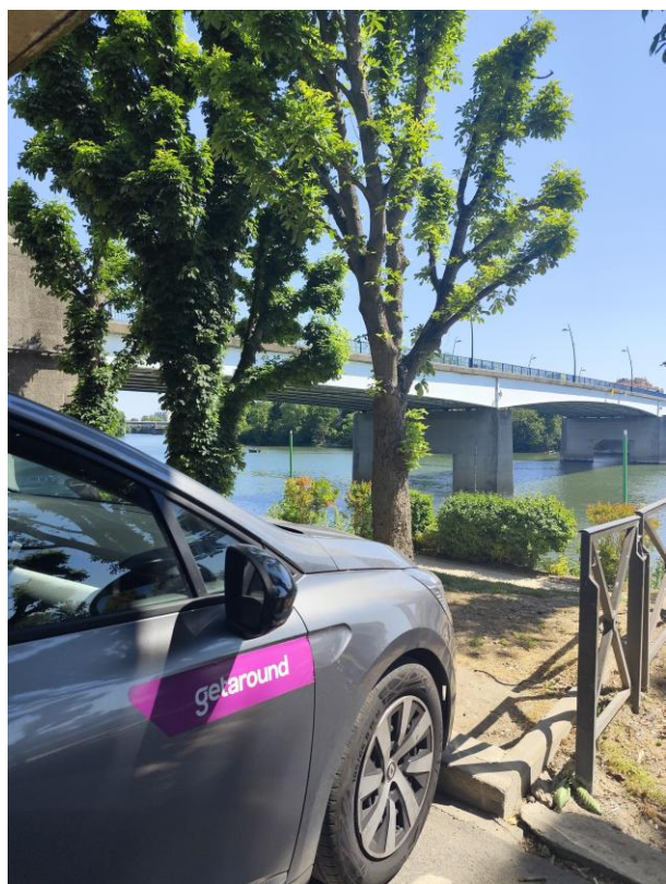
Véhicule d'autopartage stationné au Pecq

Plus d'informations sur www.getaround.com