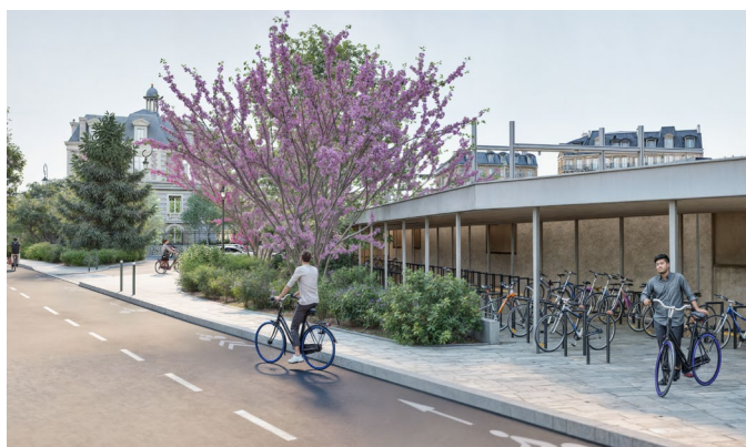
Vue du Parvis Nord depuis la rue Jean Mermoz Atelier Silva Landscaping