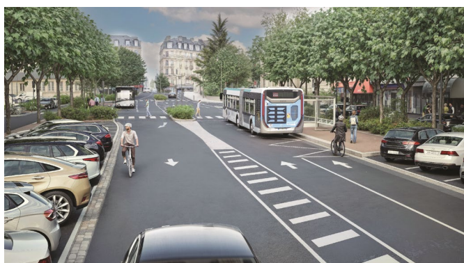
Vue des aménagements prévus avenue Longueuil Atelier Silva Landscaping

Entre le pont et le début de l'avenue Longueuil, plusieurs aménagements vont améliorer le quotidien des piétons, cyclistes, usagers des bus et automobilistes. Les espaces seront repensés pour renforcer la sécurité, faciliter les déplacements et fluidifier la circulation.