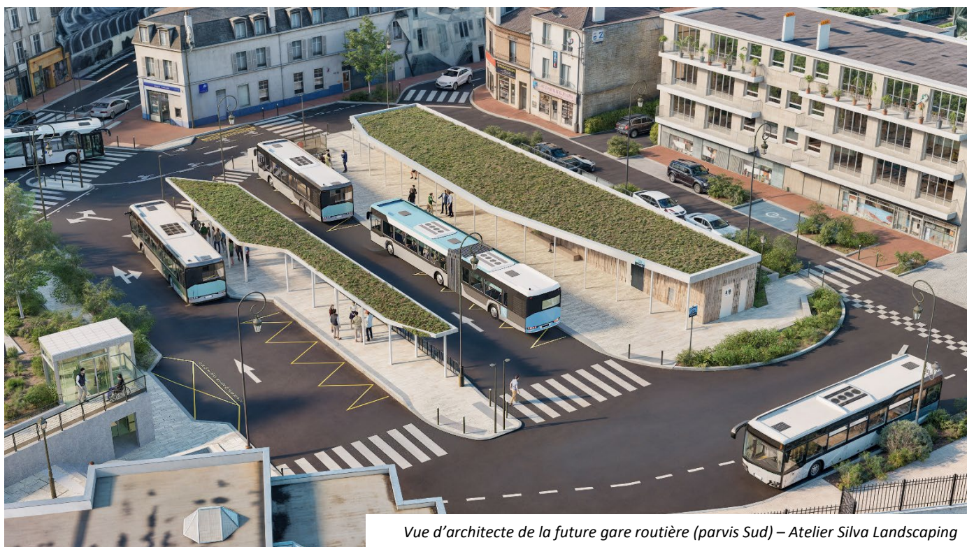
Vue d'architecte de la future gare routière (parvis Sud) – Atelier Silva Landscaping

Un pôle gare plus fluide, plus sûr et mieux connecté : c'est l'ambition portée par l'Agglo et la ville de Maisons-Laffitte. Dès le 2 ème trimestre 2026, l'Agglo réalisera sur ce site qui accueille quotidiennement plus de 14 000 voyageurs, des travaux visant à améliorer ses accès à pied, à vélo et en bus et à offrir un espace public plus agréable et plus pratique pour tous les usagers.