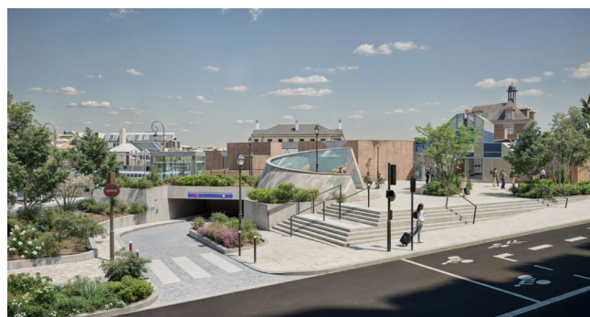
Vue du futur parvis Sud, côté sortie du parking souterrain Atelier Silva Landscaping

La gare routière sera entièrement réaménagée . Ce nouveau parvis accueillera de nouveaux quais de bus respectant les normes d'accessibilité et une consigne vélo sécurisée de 147 places avec toiture végétalisée, en lieu et place de l'ancien parking. Des sanitaires publics et un nouveau local pour les conducteurs de bus seront également créés.