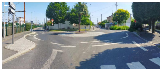
Le carrefour aujourd'hui

Lors d'une seconde phase de travaux, le tracé se poursuivra vers la gare de Sartrouville en passant par les rues de la Paix et Turgot (voir carte).