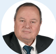
Dominique LESPARRE Maire de Bezons 8 e Vice-président Politique de la ville