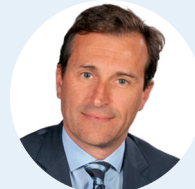
Arnaud de BOURROUSSE Maire de Carrières-sur-Seine 10 e Vice-président Développement économique et emploi Boucle Est